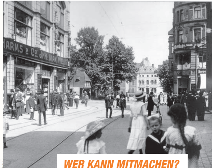
WER KANN MITMACHEN?